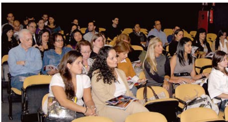
Convidados assistem a palestra sobre o mercado de casamentos