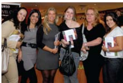
Nononono nono non on onon Nononono nono Nononono nono non on onon Nononono nono