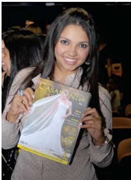
Nononono nono non on onon