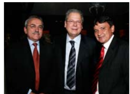
Wis dipsusto cor iustrud dolor susci et lum vel ing ent prat utatie min henim amconsequam