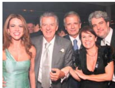
Wis dipsusto cor iustrud dolor susci et lum vel ing ent prat utatie min henim amconsequam