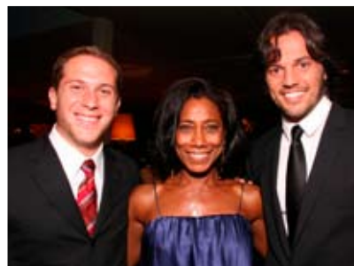
Wis dipsusto cor iustrud dolor susci et lum vel ing ent prat utatie min henim amconsequam