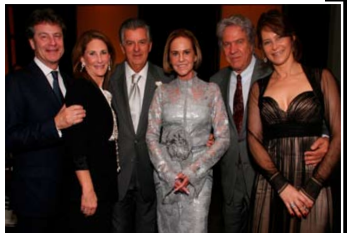
Wis dipsusto cor iustrud dolor susci et lum vel ing ent prat utatie min henim amconsequam eliquis alit nos autationse faciliq uamcons equisissi