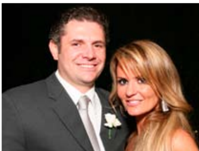
Wis dipsusto cor iustrud dolor susci et lum vel ing ent prat utatie min henim amconsequam