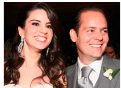
Wis dipsusto cor iustrud dolor susci et lum vel ing ent prat utatie min henim amconsequam