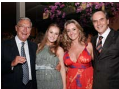
Wis dipsusto cor iustrud dolor susci et lum vel ing ent prat utatie min henim amconsequam