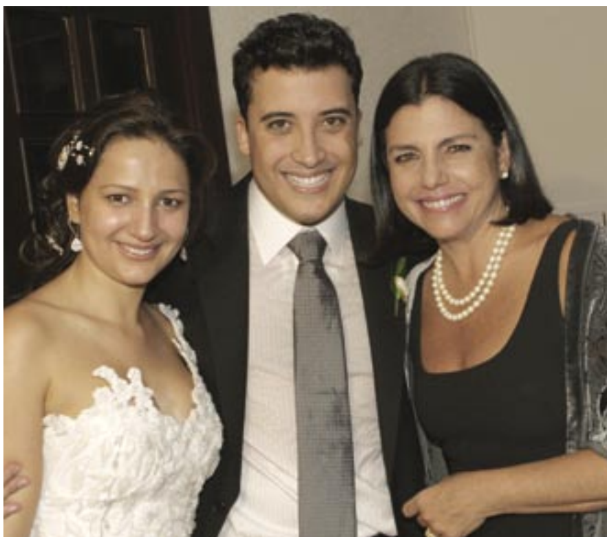
Os noivos com a senadora Roseane Sarney