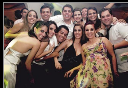
Primos, irmãos e mãe do noivo